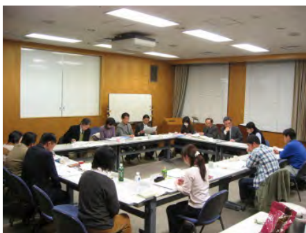
運営委員の様子。この場から様々なアイデアが生まれます。