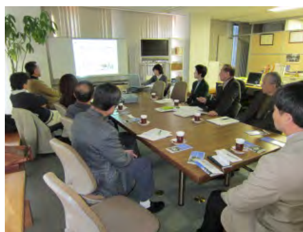
運営委員研修の様子。市内で活動している NPO の生の声を聴き今後の議論に活かしていきます。