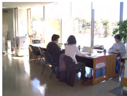
市民活動センターオープンスペース “予約は不要。打合せなどにご活用ください”