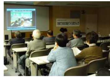
第 27 回「地域で交流の場をつくりませんか」