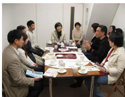
運営委員研修の様子。市内で活動しているNPOの生の声を聴き今後の議論に活かしていきます。