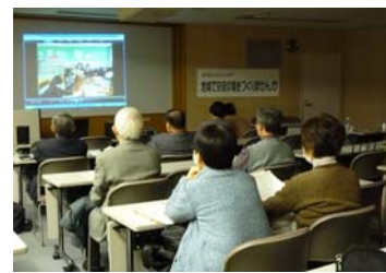
第 27 回「地域で交流の場をつくりませんか」