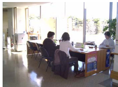
市民活動センターオープンスペース “予約は不要。打合せなどにご活用ください”