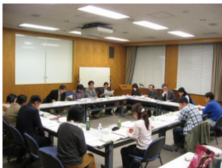
運営委員の様子。この場から様々なアイデアが生まれます。