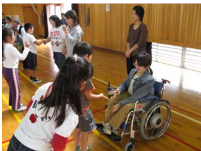
障害のある方との交流プログラム。 人と関わる場面をつくることで、様々な気づきが生まれます。

そんな市民像を描きながら、市内の小・中学校、高校、各種学校と、地域の人や機関、市民活動団体とともに授業プログラムを協働でつくっていきます。