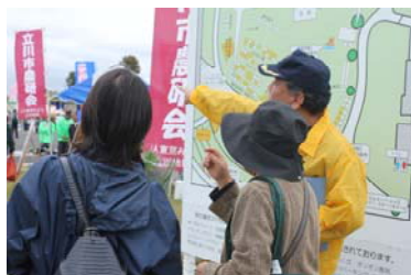
第 24 回、25 回「楽市を楽しむ、案内人!!「ボランティア入門講座」