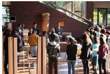
第 26 回「1000 人以上の音楽祭 スタッフ募集」