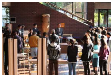
第 26 回「1000 人以上の音楽祭 スタッフ募集」