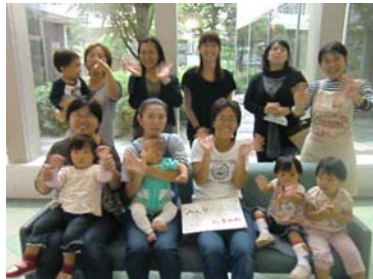
子どもと一緒に、お母さん方が支えあって自主的な活動をしています。 みなさん、いい笑顔☆