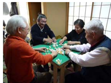
男性でも気軽に参加できる、麻雀、囲碁、料理教室などもあります。