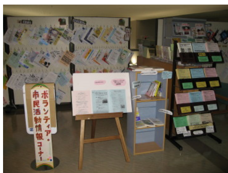
情報コーナー “情報が欲しい市民と 情報を届けたい市民の接着剤”

総合福祉センター内 2 階にて、紙媒体による情報収集、インターネットでの情報検索ができるコーナーを運営。